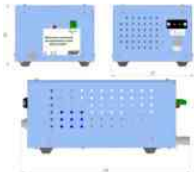
Рисунок 7.4 – Источник питания постоянного тока БП-4

БП-3 предназначен для питания источников максимальной мощностью до 11 Вт. Изготавливается одно- двух- и четырехканальный. Крепление на Din-рейку.