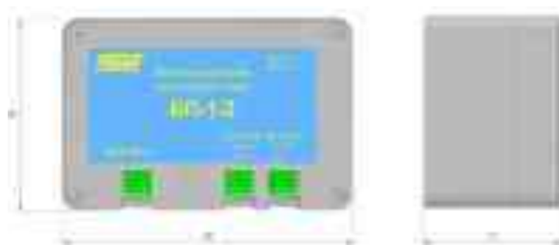
Рисунок 7.1 – Источник питания постоянного тока БП-1 в открытом исполнении

БП-1 предназначен для питания источников максимальной мощностью до 25 Вт. Изготавливается одно-, двух-, четырех- и пятиканальный.